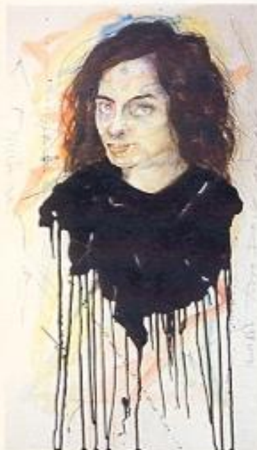
QUANDO TUTTO DEVE ANDARE NULLA VA tecnica mista, 30 x 70, 2005