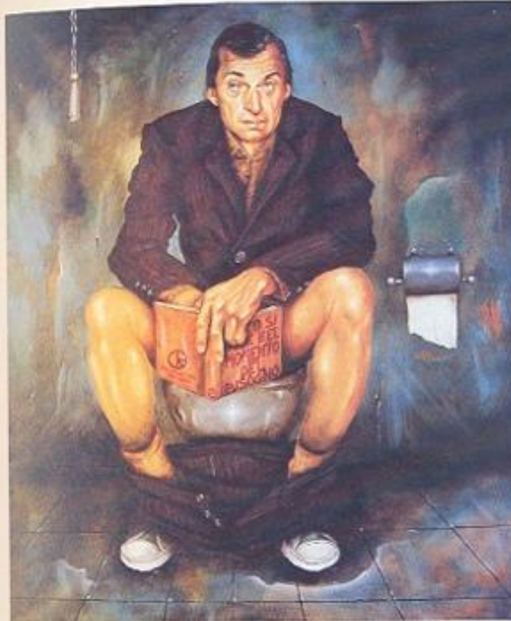
L'AMICO SI VEDE NEL MOMENTO DEL BISOGNO olio su tela, 100 x 110, 2003