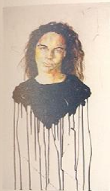
QUANDO TUTTO DEVE ANDARE TUTTO VA tecnica mista, 80 x 70, 2005