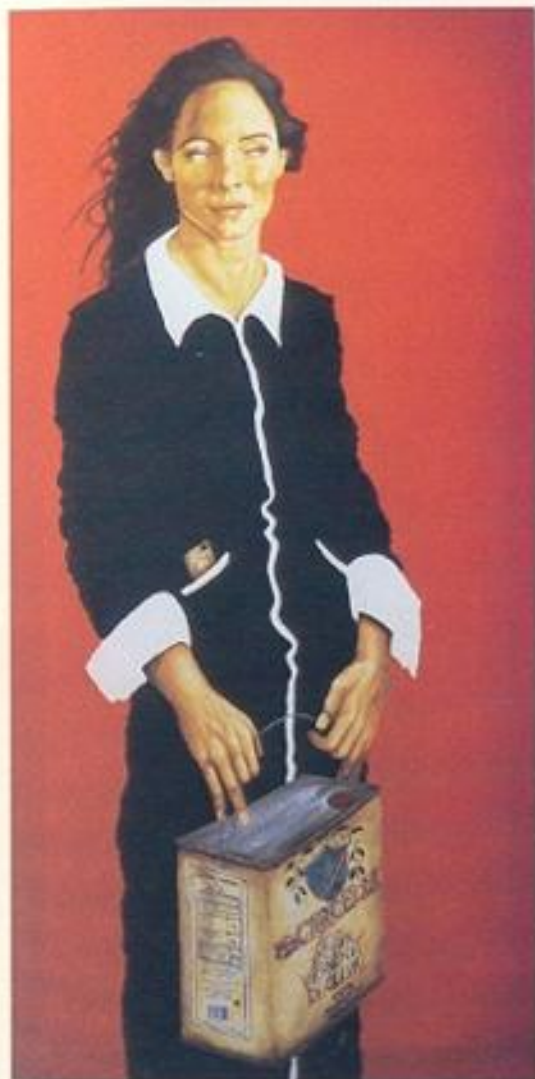
"ASSÛ..." tecnica mista, 27 x 35, 2003