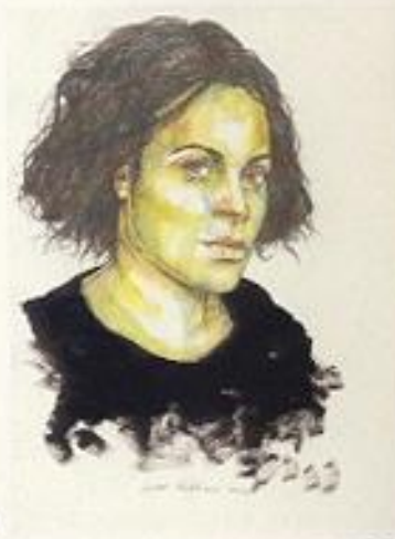
GUARDAMI NELLE PALLE DEGLI OCCHI tecnica mista, 27 x 35, 2003