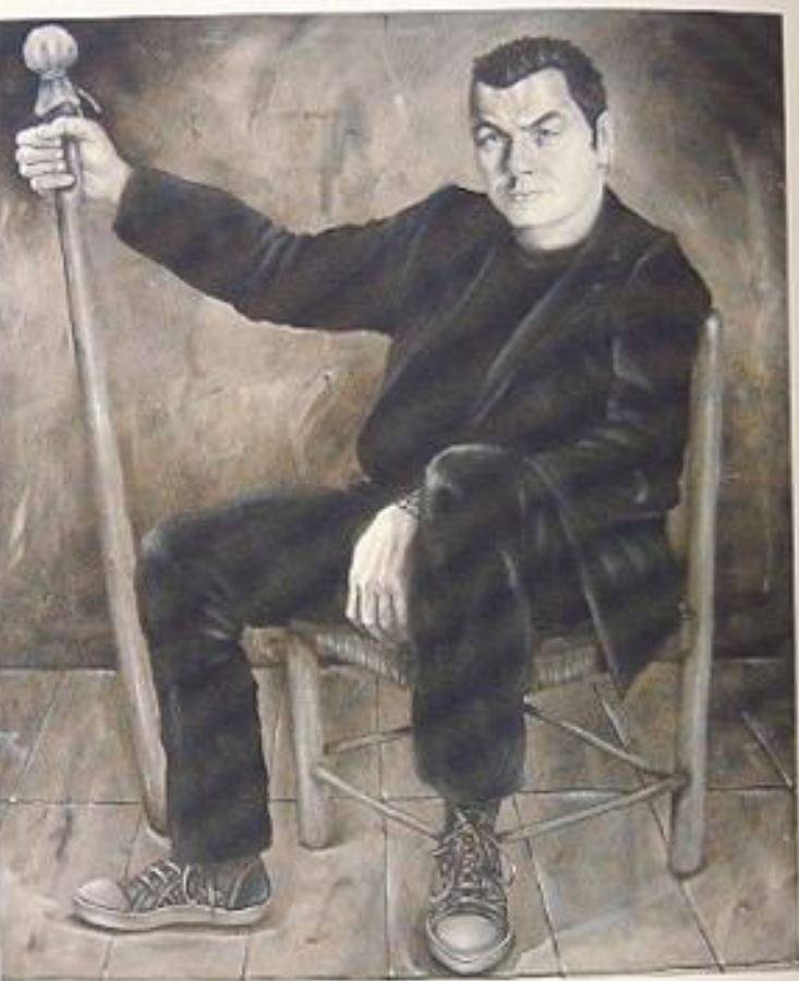
NON CREDO IN DIO MA GUARDANDOMI POTREI RICREDERM olio su tela, 100 x 120, 2005