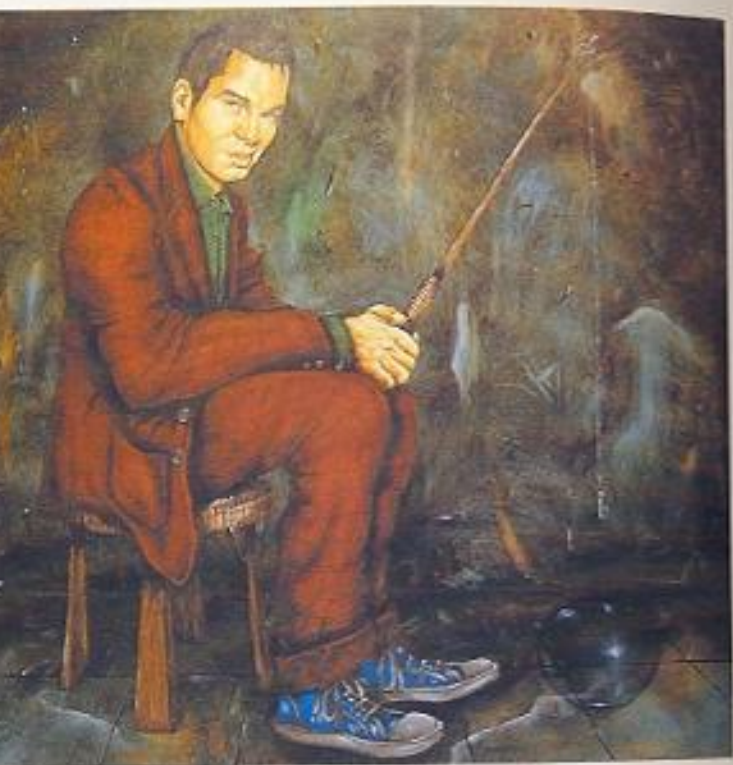
pagina precedente: TE LA DO ME LA RIDARAI? su tela, 80 x 120, 2005